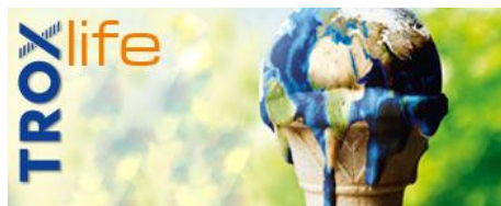
CLIMATE AND CHANGE.