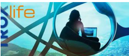
COUNTRY AIR, CITY AIR.

You have missed an issue of the TROX life? You can choose here which issue(s) of TROX life you would like to order free of charge.