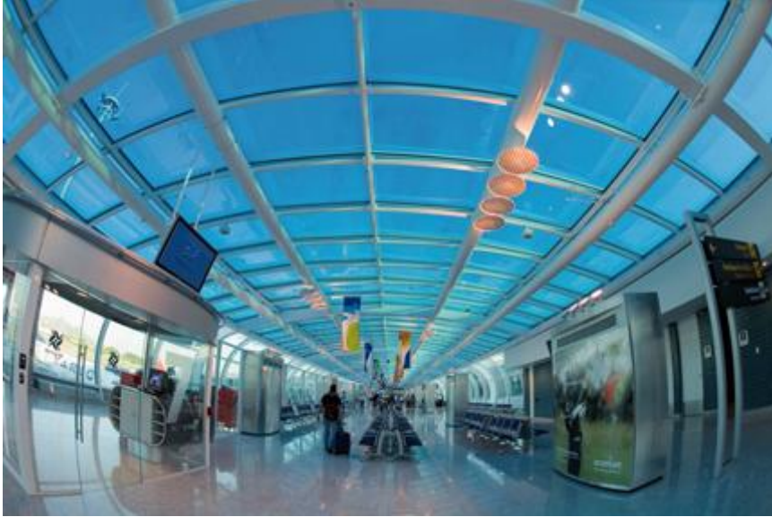
Sviluppo di diffusori ad effetto elicoidale per l'aeroporto Santos Dumont di Rio de Janeiro